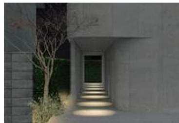
エントランスアプローチ夜景